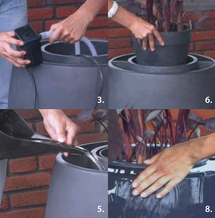
step by step