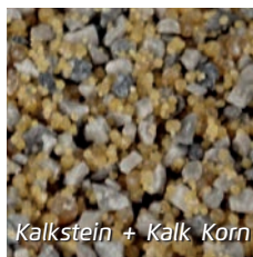
Kalkstein + Kalk Korn