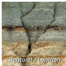
Bentonit / Lanthan