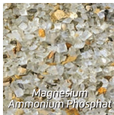
Magnesium Ammonium Phosphat