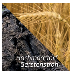
Hochmoortorf + Gerstenstroh