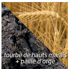
tourbe de hauts marais + paille d'orge

L'orge est connue comme matière première de la bière et des aliments du bétail. Ces pailles aussi jouent un rôle utile dans le bassin. Lors du processus de dissolution de la paille d'orge, le taux de phosphate présent dans l'eau diminue et les algues du bassin sont éliminées de manière naturelle.