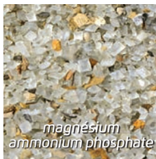
magnésium ammonium phosphate

Les eaux usées contiennent des substances précieuses pour la croissance des plantes. Par conséquent, Vincia a fabriqué un comprimé nutritif à partir du produit résiduel des stations d'épuration des eaux usées. Ce recyclage est important étant donné que l'extraction naturelle du phosphate est en régression suite à la pénurie du phosphate.