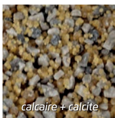
calcaire + calcite

Un produit résiduel du processus de production de l'eau potable est le grain de chaux qui se forme au moment de l'adoucissement de l'eau et laisse une fine couche calcaire sur les grains de sable. Comme pour le gazon, la chaux contribue à absorber la vase de fond présente dans le bassin et à la transformer en nutriments pour les plantes aquatiques.