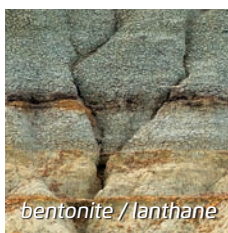
bentonite / lanthane

L'enrichissement de la bentonite, une argile naturelle, avec du lanthane, un métal terreux, permet d'obtenir un produit d'argile qui coule au fond du bassin et absorbe le phosphate. Résultat : on élimine ainsi une source de nutriments importante pour les algues et on stoppe la prolifération des algues filamenteuses et en suspension.