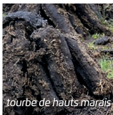
tourbe de hauts marais

Ajoutée à l'eau, la tourbe forme un milieu de vie sain pour les poissons et les plantes du bassin. Les acides humiques qui sont libérés diminuent naturellement le pH de l'eau. La tourbe de hauts marais est comprimée sous forme de granulés pratiques à utiliser.